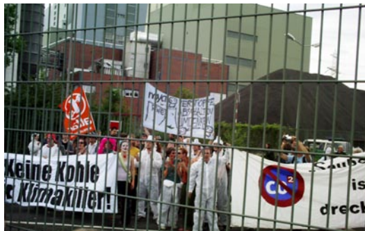
Eisbären (noch) vor dem Kohleberg - auf der Demo vor dem Kohlekraftwerk in Mannheim

Alles Erlernte konnte man direkt im Anschluss auf der Demonstration am Samstag gegen den Bau des „Block 9“ des Kohlekraftwerkes Mannheim einbringen. Bunte Farben, laute Trommeln, wehende Fahnen und lustiges Theater bildeten den Kern der Demo im südlichen Mannheim. Rund 600 Demonstranten zeigten ihren Unmut gegen das, dem Klimawandel gegenüber, blinde Ausbauen und Errichten von Kohlekraftwerken in Deutschland. „Kohlekraft ist Rückschritt...Kohlekraft ist Rückschritt!“ rief die bunte und lautstarke Menge, während alle Teilnehmer rückwärts die Straße entlang liefen. Gleichzeitig tanzte eine große Eisbärenpuppe, die im Großpuppenbau-Workshop erstellt wurde. Auch die Clowns, die ihr Werk gerade erst auf der Aktionsakademie erlernt hatten, präsentierten sich und machten sich über alles und jeden lustig. Die Sambatruppe, auch aus einem Workshop entstanden, rundete dann alles nochmal schön ab.