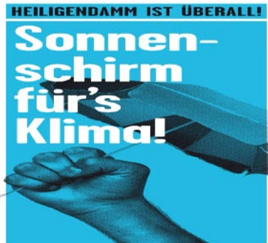
Das Klimacamp 2008 in Hamburg: Campingstuhl eingepackt und los!

Unsere Zelte werden wir in Hamburg aufschlagen, in der größten Hafenstadt in Deutschland, dem meist frequentierten Logistik- Knotenpunkt von Schiffs- und Straßenverkehr. Dazu gehört auch der größte Kohlehafen, wo Nachschub aus Australien, Indonesien und Kolumbien für hiesige Kraftwerke und Industrien