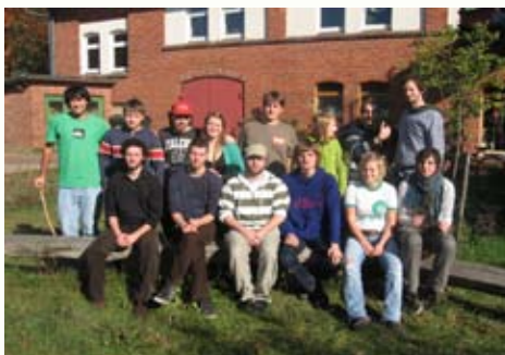
Das ist das Noya-Bundesorgateam

Das Bundesorgateam ist immer offen für neue Leute. Wenn ihr Interesse habt, euch im Team zu engagieren, könnt ihr euch gerne über info@no-ya.de bei uns melden. Wir brauchen ständig Unterstützung.